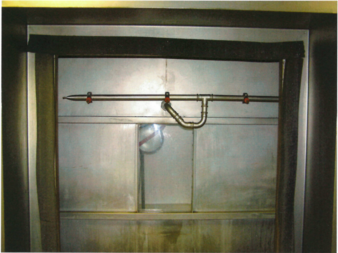
Bild 2: Offener Prüfstand mit Anordnung der drei wassersprühenden Düsen