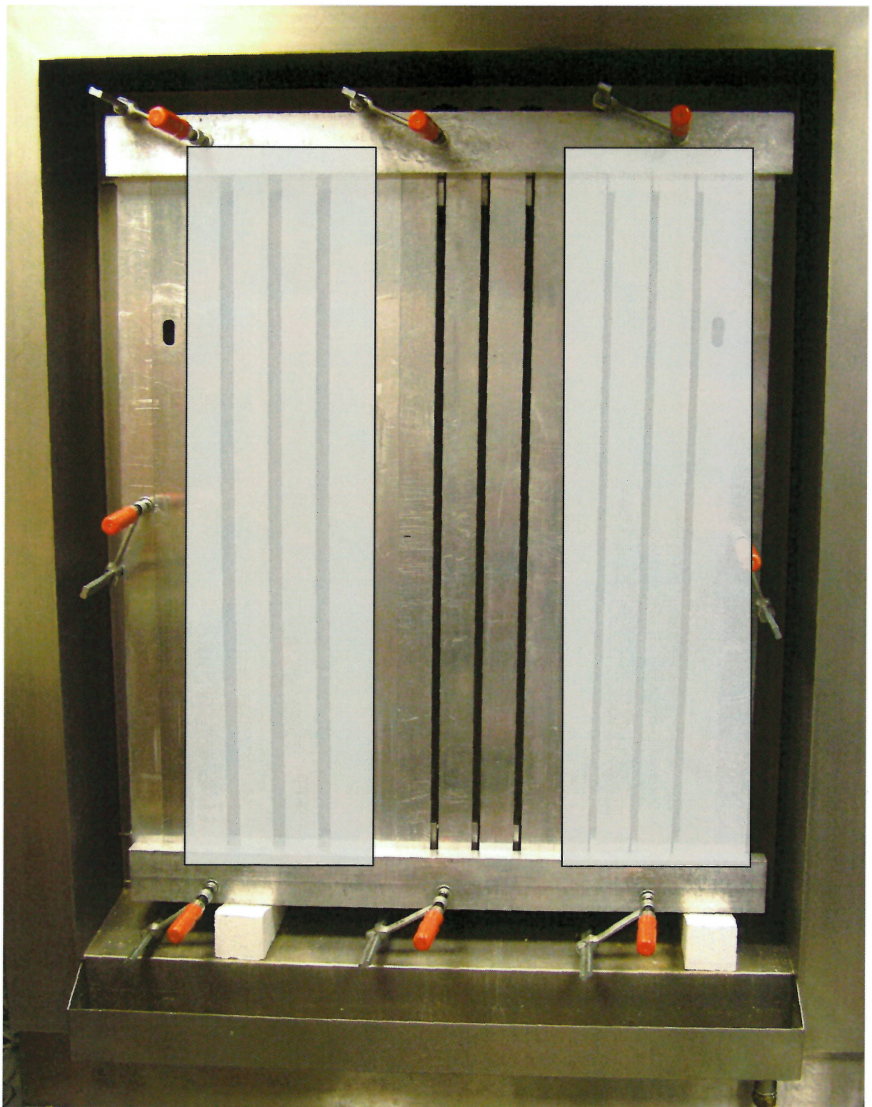
Bild 5: Versuchskörper, bestehend aus Hohlkammerprofilen (Querschnitt 60 mm x 100 mm) mit dazwischen befindlichen Fugen, in denen das Fugendichtungsband eingebaut ist. (Größe des Versuchskörpers (rd.): Höhe 1,38 m x Breite 1,07 m.)

Fugen 4-6: Fugenbreite 15 mm, Bandbreite 30 mm (Fugentiefe)