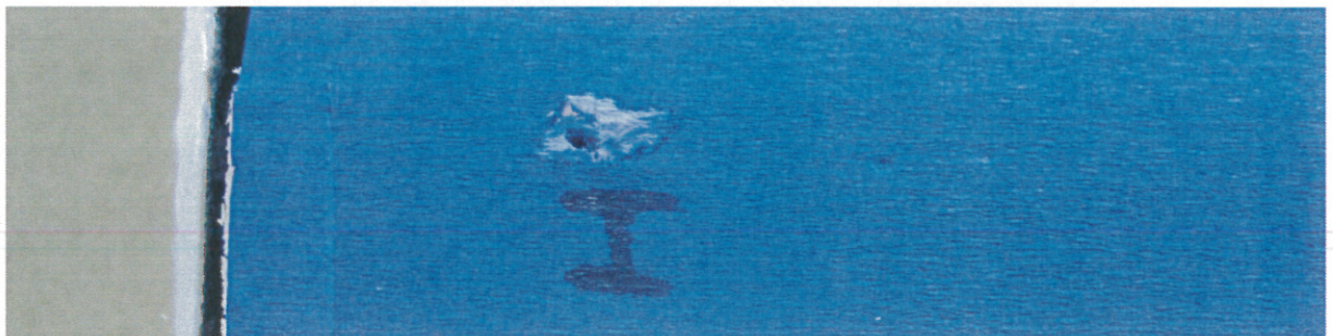
Abbildung 2: Wassereintritt der Klasse I gemäß ÖNORM B 3647 nach der Prüfung

Ein Wassereintritt Klasse I (siehe Abbildung 2)